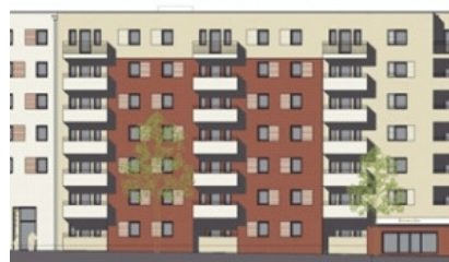
Straßenansicht - Wattstr